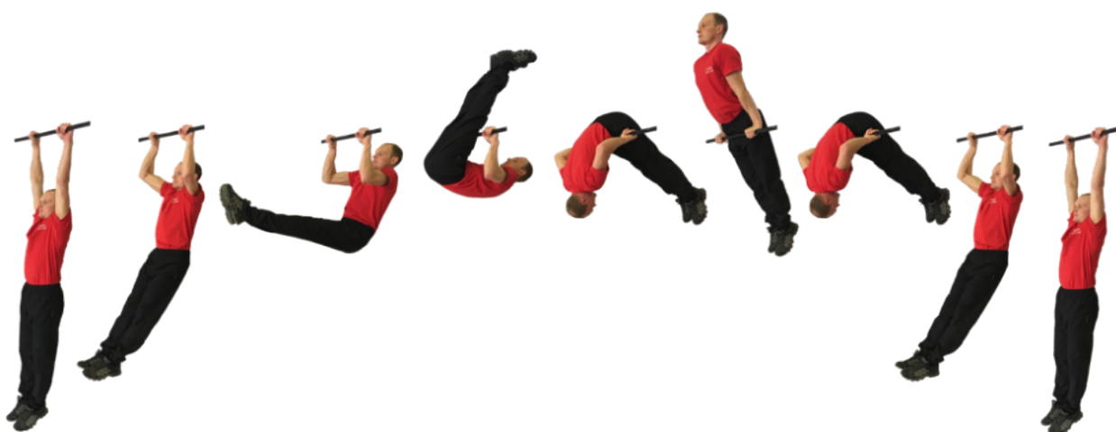
Рис. 2. Подъем переворотом на перекладине