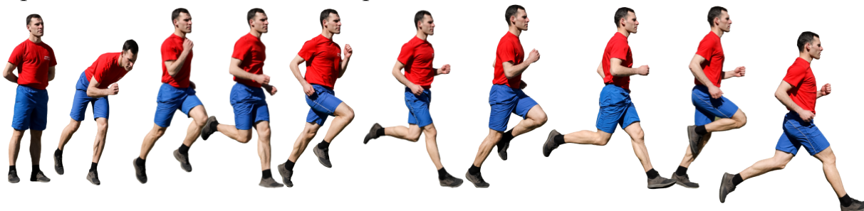
Рис. 7. Бег на 1 км, бег на 3 км.

Старт и финиш, как правило, оборудуются в одном месте. При выполнении упражнений на беговой дорожке стадиона старт и финиш производится в соответствии с разметкой стадиона.