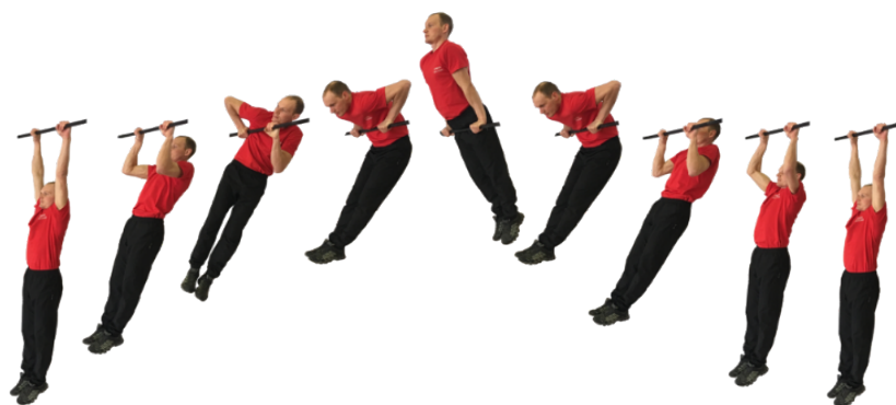
Рис. 3. Подъем силой на перекладине