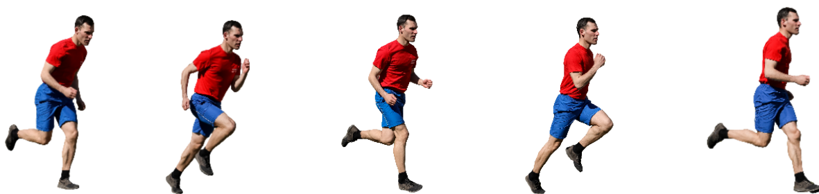
Рис. 5. Бег на 60 м, бег на 100 м