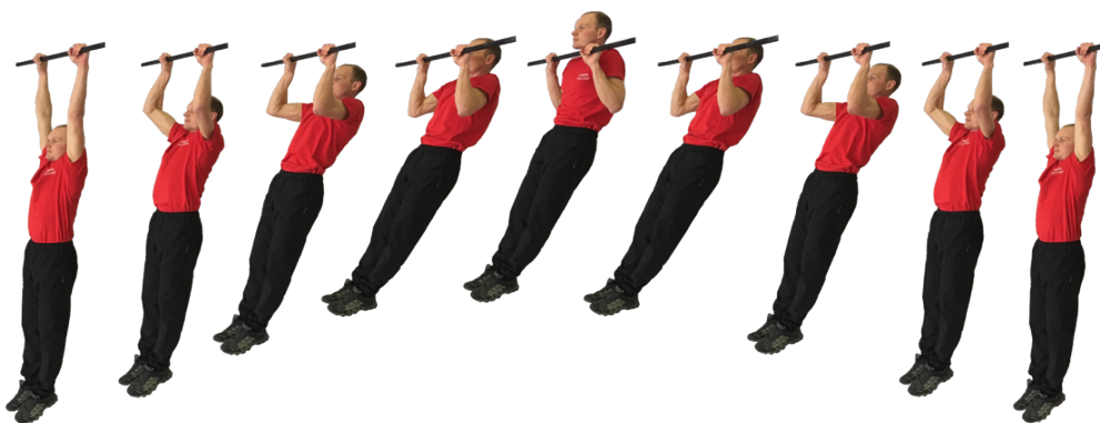
Рис. 1. Подтягивание на перекладине